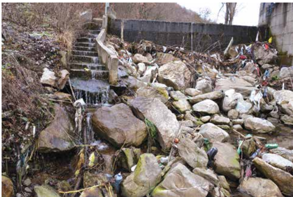
4. Suho korito i smeće na vodozahvatu MHE Hum, rijeka Jasenica, Travnik, 15.12.2020.