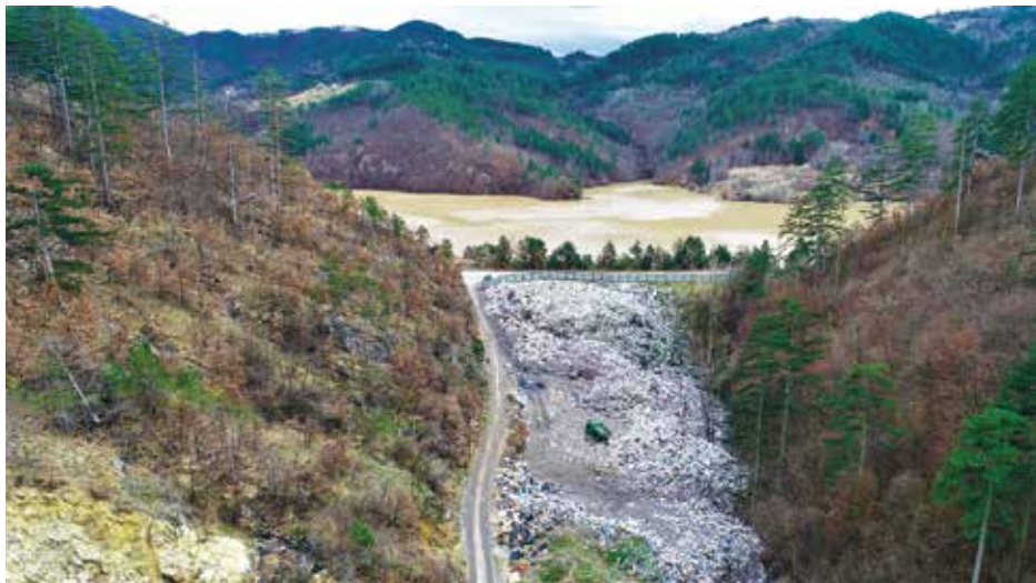
3. Gradska deponija pored Drine Višegrad, 09.02.2021