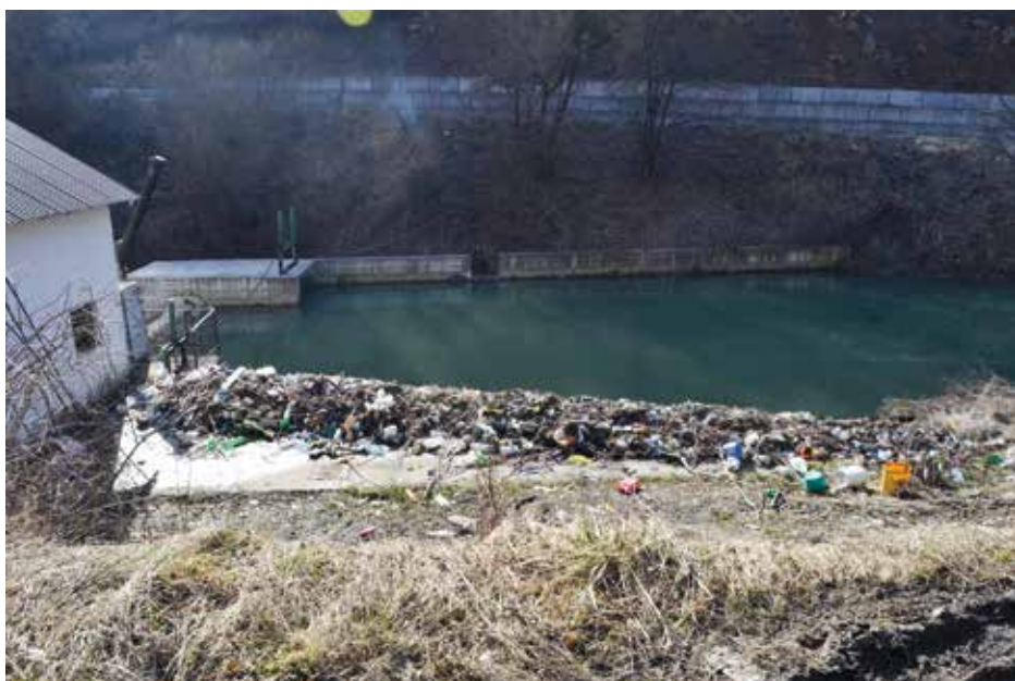
5. Smeće na vodozahvatu MHE Dolac, rijeka Bila, Travnik, 23.02.2021