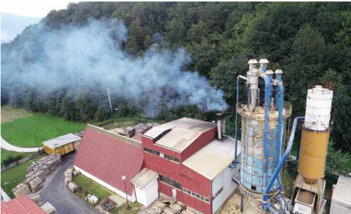
10. MS Wood Fojnica, 14.09.2020