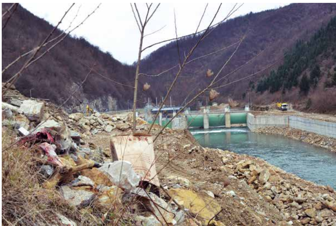
11. Mrtva srna na akumulaciji MHE Merdani, rijeka Lašva, Busovača 14.12.2020