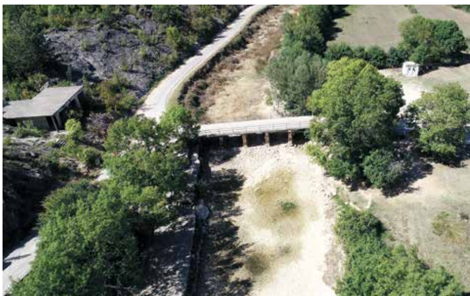
8. Suho korito rijeke Kraljušćice ispod vodozahvata, Konjic 26.10.2018