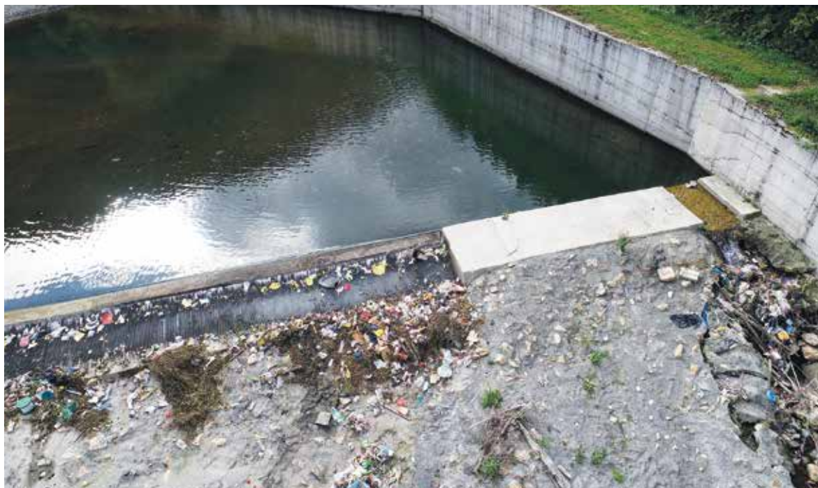
1. Rijeka Vrbas - G.Vakuf-Uskoplje, vodozahvat MHE Voljevac, 14.09.2019