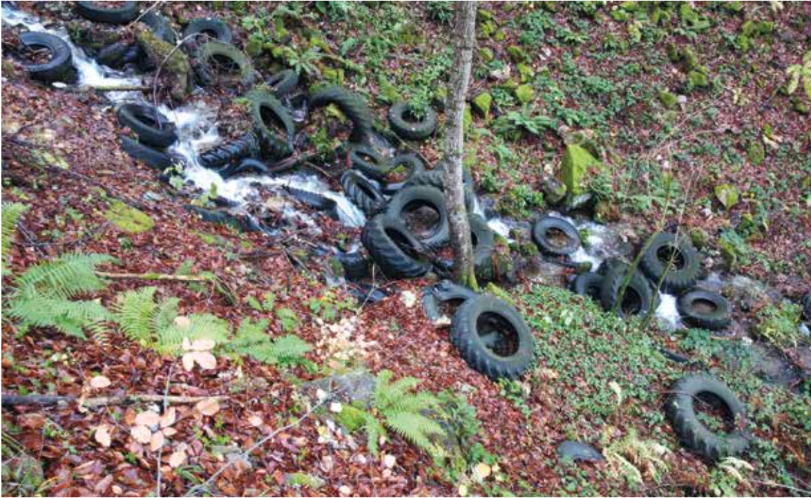
9. Traktorske i kamionske gume u Trošnjičkom potoku, Fojnica 13.11.2021.