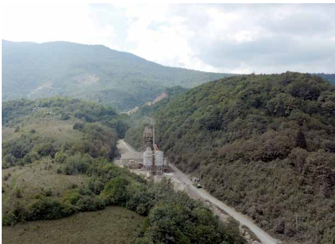
12. Krečana BFS, Kreševo, 30.08.2022.