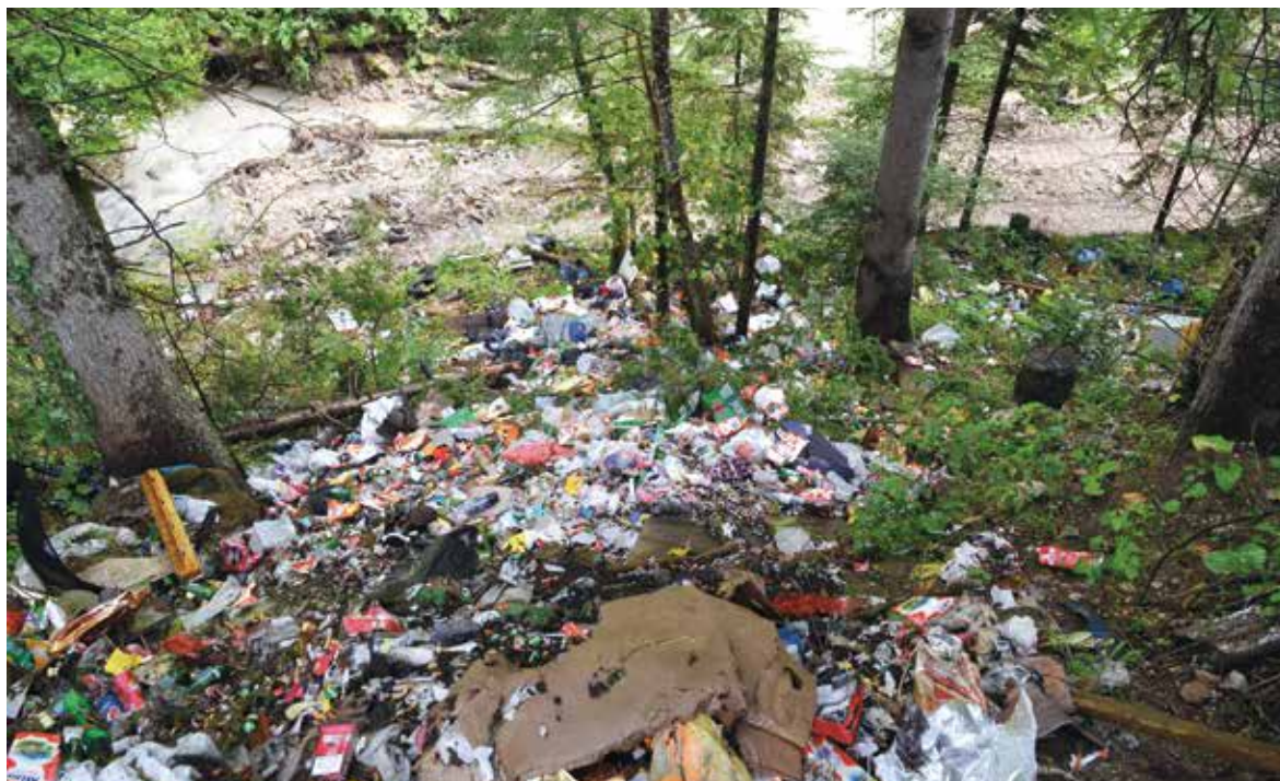
2. Divlja deponija pored rijeke Ugar, Travnik, 25.09.2020